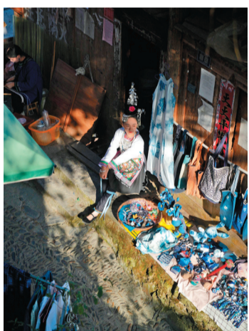
卖民俗特产的姑娘。

大利侗寨的美,在于它与自然的和谐共生。寨子被两座大山环抱,利洞溪从寨中穿过,将整个村落分割成两部分。溪边,400多株古楠木参天而立,遮天蔽日,如同侗寨的守护者。这些树木不仅是侗族人“老人护村,古木佑寨”传统观念的体现,更是侗寨生态智慧的见证。