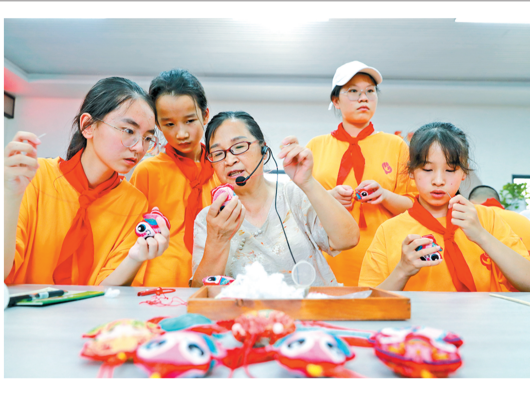
7月2日,参加“老少同声颂党恩·携手奋进新征程”青少年夏令营的孩子们,在泸州市纳溪区护国战争博物馆体验非遗手工香囊制作。

调研组建议,要因因地制宜,坚持市场化导向,发挥柑橘、枇杷产业优势,加强与企业、合作社等新型经营主体合作,探索“村集体+企业+农户”合作模式,提高村集体经济的市场化运作水平和抗风险能力。要加强闲置资源和资产的统筹利用,通过出租、入股等方式发展民宿、康养产业等,推动资源向高效利用转化。要加强人才培养和引进,注重发挥本土人才作用,为村集体经济提供有力的人才支撑和智力保障。